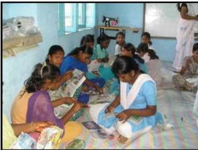
Chicas del grupo de Corte y Confección durante una clase. Recibirán una educación completa.

Además del laboratorio de tejido, existe una escuela de Corte y Confección que acogerá a 20 aprendices.