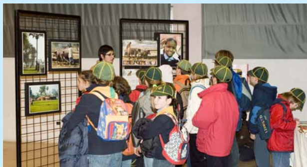
Un gruppo di scout in visita alla mostra di Piero Sirianni a Casale Monferrato.

Presso la Sala espositiva Baraccano, via S. Stefano 119, a Bologna sarà esposta la Mostra Fotografica "I ragazzi di Alice: la scuola che insegna a sorridere" , a cura di Piero Sirianni.